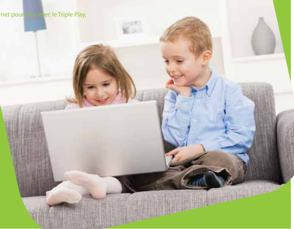
Internet pour toutes les générations

L'internet pour tous avec le Triple Play,